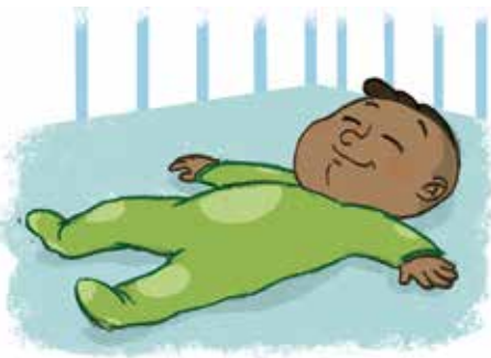
... ከዕርፍ ብድሕሪኡ