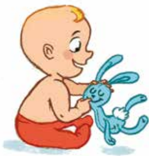
... ንምዕትዓት ነገራትን ብክኩም ምጽዋትን