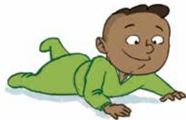
... ምምሃር ምቅደጻር ኣቃውማይን ምንቀስቓሳተይን