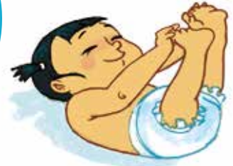
... ምድህሳስ ሰብነተይ