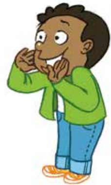
... ምግላጽ ገዛክ ርክሰይ