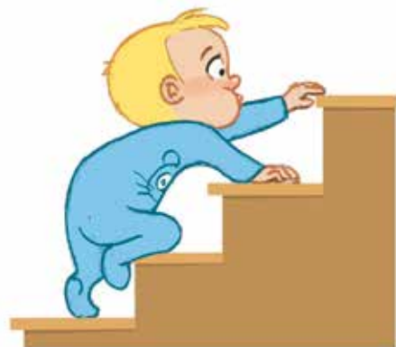
... ምምሃር ደረት ፃቕመይን ምውጋድ መጉዳክትን