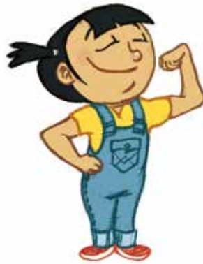
... ምምዕባል ጥንካረን ሜላን