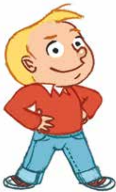
... ምህናጽ ርክሰ-ተካማንነተይ