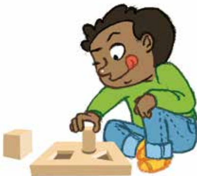
... ምስታፍ ኣብ ዘይኩለፍ ጸወታ