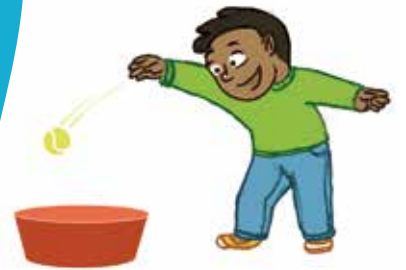
... ምስ ናይ ገዛክ ርክሰይ ሰብነት ዝያዳ ክላለን ናተይ ናይ ረቂቕ ሞተር ክክለታት ክመሓይሽን