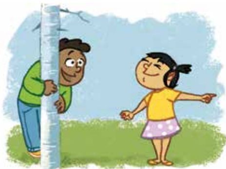
... ካልኦት ቅልዑ ክረክብ