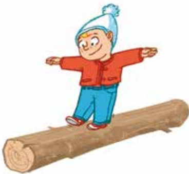
... ምምሕደሽ ናተይ ተዓጻጻፍነት ክምኡ'ውን ንምቕናዕ ጸዓተይን