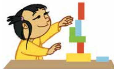
... ኣክባቢይ ክምሃርን ክርዳክን