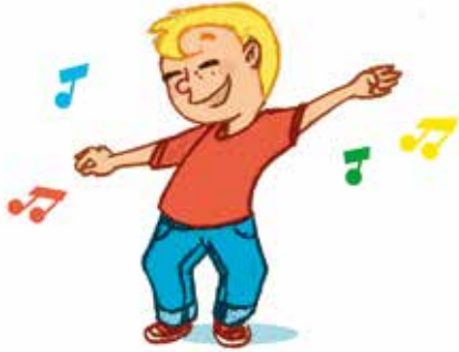
... ምምዕባል ሰብኣዊ መንነተይ