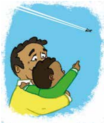
... ምርድዳኽ ናይ ኢድ ምንቅስቃስ ተጠቐምካ