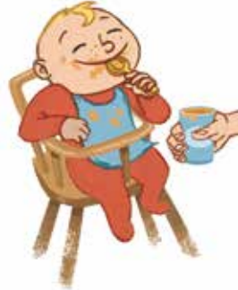
... ምድህሳስ ነገራትን ናጻ ንምኳንን