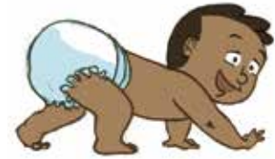
... ምምሃር ከመይ ኢልካ ከምተንፍፋሉኻ፡ ደው ትብልን ብኸግሪ ትሸይድን