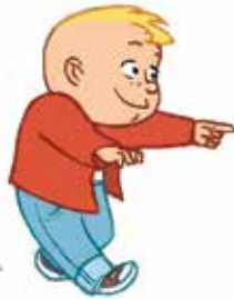
... ምድህሳስ ዝሰፍኡ ዘሎ ከባቢታተይ