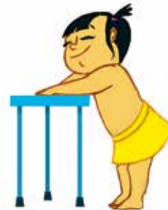
... ምምሃር ምቅራጽ ኣቓውማይን ምንቅስቃሳተይን